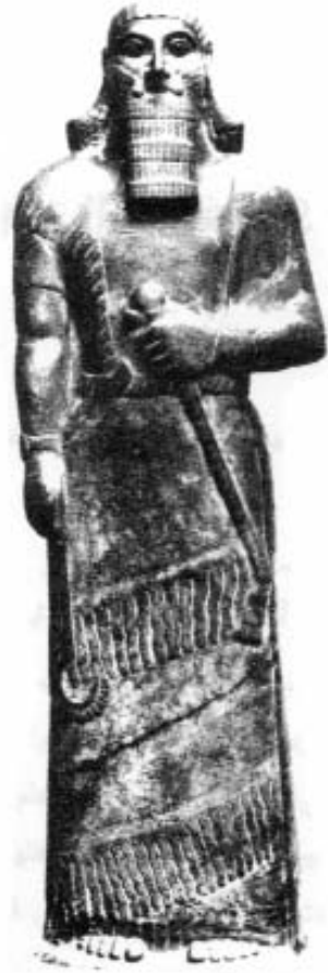
مؤسس كالح نمرود آشور ناصر بال - الثاني ملك آشور