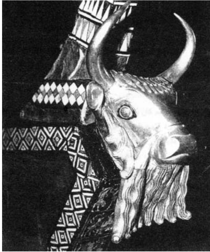
كنارة مدينة أور