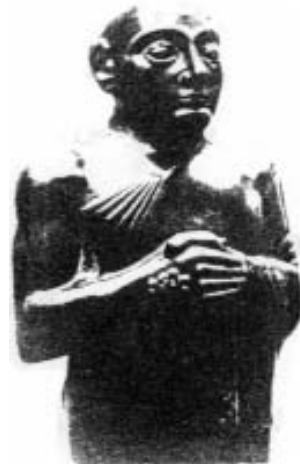
صورة لحاكم مدينة - دولة لاغاش. من تلو، جنوب العراق. من أيام السومريين. حوالي ٢١٠٠ ق.م