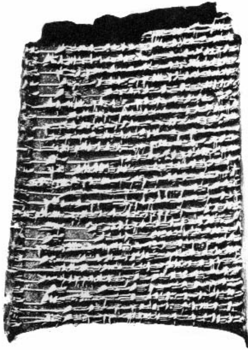
لوح منقوش عليه جزء من قصة الخلق البابلية القرن السابع ق. م