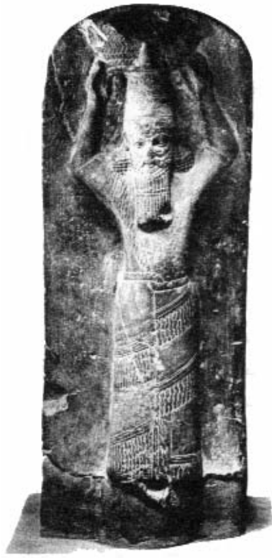
آشور بانيبال ملك آشور ٦٦٨ - ٦٣٠ ق.م يودي شعائر إعادة بناء معبد الإله