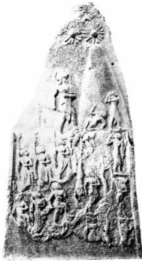
مسلة نارامسين الآكادي متحف اللوفر