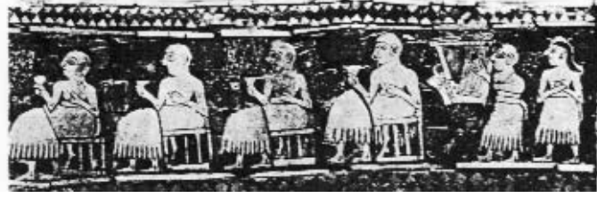
المأدبة السومرية - متحف لندن