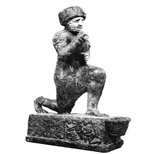
حمورابي (متحف اللوفر)