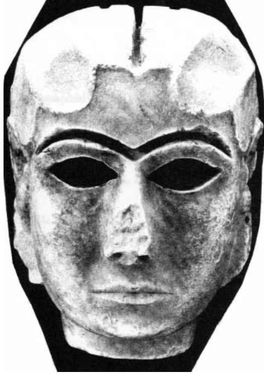
قناع امرأة أور