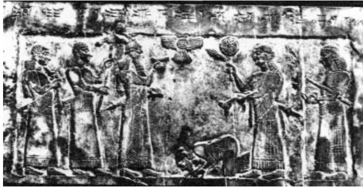
المسلة السوداء - المتحف البريطاني ملك اسرائيل ياهو يخضع كشلمناصر الثالث ملك آشور